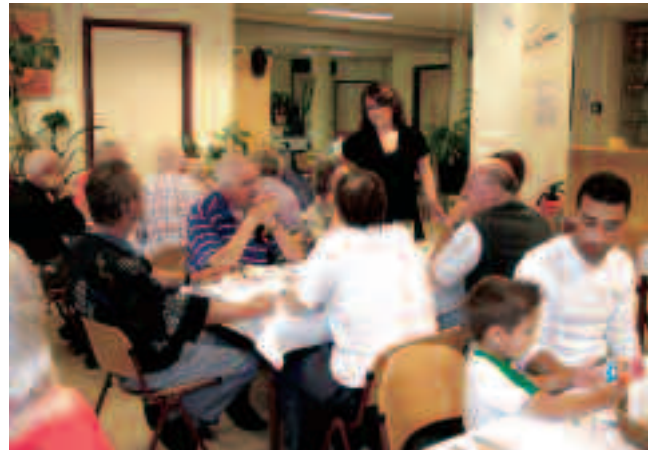
Het eerste, in 2004 geopende, VanHarte Resto aan het Joncbloetplein in Den Haag

Na Artsen zonder Grenzen werkte ik bij UNICEF en ook een tijd als vrijwilliger bij de Boodschappen- en Begeleidingsdienst in Den Haag. Ik ging naar mensen om met hen boodschappen te doen, naar een supermarkt bijvoorbeeld. Toen ontdekte ik dat