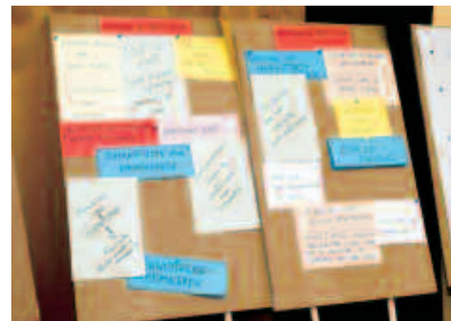
Een greep uit de reacties

Conferentiedeelnemers konden een formulier invullen met hun commentaren, opmerkingen en aanbevelingen, of een e-mail sturen naar de Stichting Beroepseer.